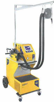
Gyspot Evolution PTI-s7

Die deutsche Tochtergesellschaft des französischen Herstellers GYS in Aachen berichtet, dass der durch die Daimler AG Ende des letzten Jahres in Auftrag gegebene Test des Inverter-Punktschweißgerätes GYSPOT Evolution PTI-s7 erfolgreich verlief. Die Maschine und das vom Stuttgarter Automobilbauer definierte Ausführungs- und Ausstattungspaket erhalten innerhalb des Konzerns eine auf dem hauseigenen Werkstattausrüstungsportal GOTIS in Kürze bekannt gegebene Anwendbarkeitsempfehlung.