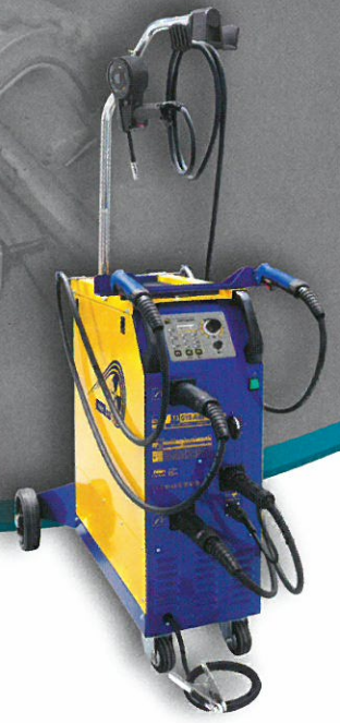
MIG/MAG LÖT- UND SCHWEISSMASCHINEN große Modellvielfalt ab € 1.150,- Aktionspreis