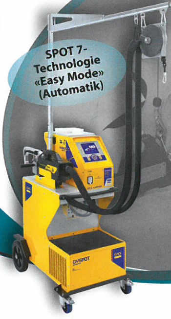
PUNKTSCHWEISS-ANLAGEN große Modellvielfalt ab € 4.563,- UVP