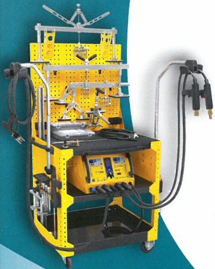
AUSBEULSPOTTER MOBILE STATIONEN große Modellvielfalt ab € 885,- Aktionspreis