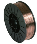
Bobine fil Acier Ø 1.0 mm 5kg