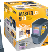
Masque à cristaux liquides 9/13