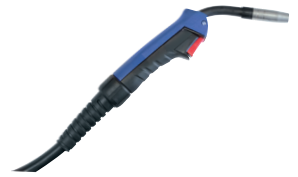
Torche 250A - 4m Binzel