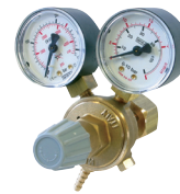
Mano-détendeur 20 L