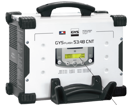
Intuitive Bedienung in 22 Sprachen