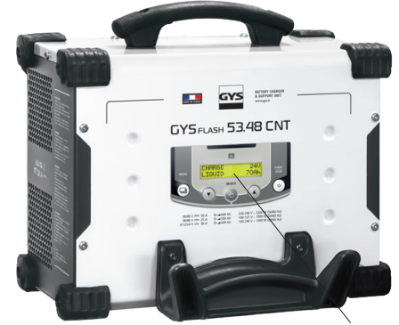
Intuiitiivne kasutajaliides saadaval 22 keeles.