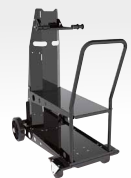
Chariot ref. 041257