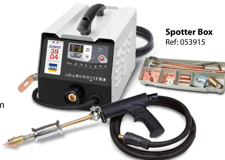
Spotter Box Ref: 053915

Zavarivanje se pokreće automatski jednostavnim kontaktom između alata i dijela koji se ravna.