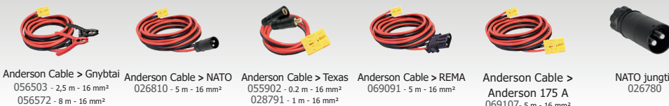
Anderson Cable > Gnybtai 056503 - 2.5 m - 16 mm 2 056572 - 8 m - 16 mm 2