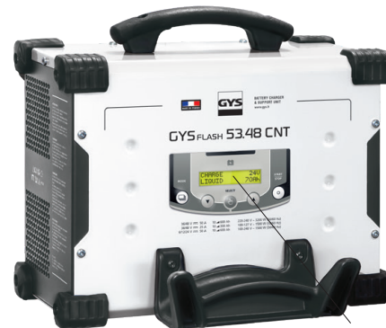
Intuityvi sąsaja priinama 22 kalbomis