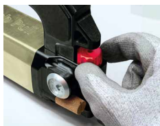
压力调节 0 - 6.5 bar