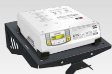
Ράφι τοίχου 055513