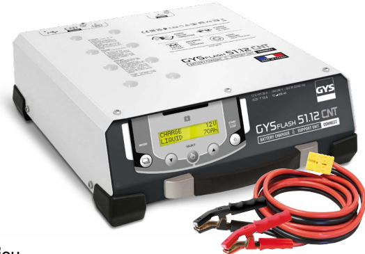
Παρέχεται με καλώδια (2,5 m - 10 mm 2 )