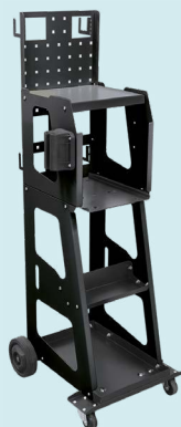
Wózek Spot 1000 ref. 053540