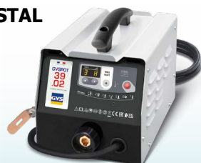
EASYLINER 39.02 - ref. 053618