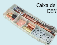
Caixa de consumíveis DENT BOX EASY ref. 053632