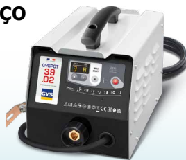
EASYLINER 39.02 - ref. 053618