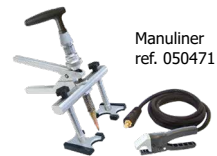
Manuliner ref. 050471