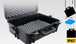
Prenosni kovček 060432